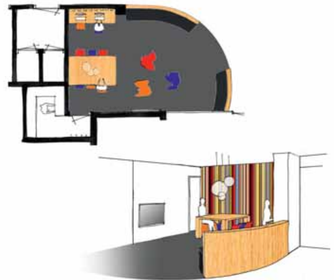
FOTO LINKS Centrale entree aan de betegelde ziekenhuisstraat

Gevraagd werd een zelfstandige zorgunit te ontwerpen: polikliniek, afdelingen radiologie, OK en IC met de nodige verpleegafdelingen. dJGA werkt voor dergelijke multidisciplinaire projecten in België samen met AR-TE / STABO, een architecten- en ingenieursbureau uit Leuven. Zij zijn primair verantwoordelijk voor de technische uitwerking van het